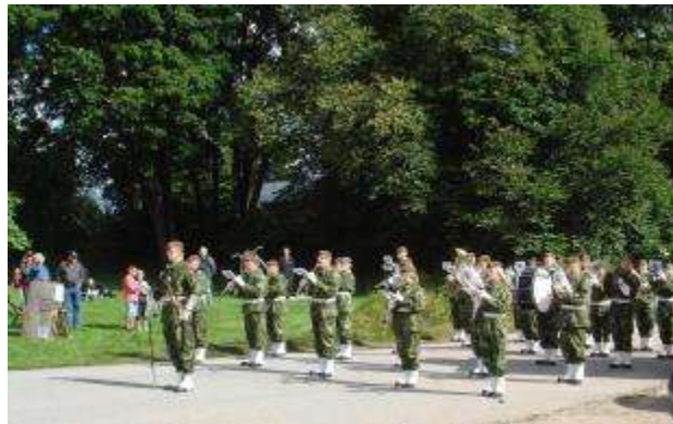
Hemvärnets musikkår ställde upp och konserterade båda dagarna

Föreningen Landeryds Järnvägsmuseum har för avsikt att rusta upp hela stationsmiljön. För detta har man fått EU-pengar i ett projekt som skall vara i 3 år. Bangården ligger kvar intakt med upp till 6 spår. Tyvärr är alla utom 3 spår kraftigt igenväxta. Även spår 1,2 och 3 behöver en rejäl ogräsbekämpning. Kvar finns också godsmagasin och lokstall samt vagnvåg.