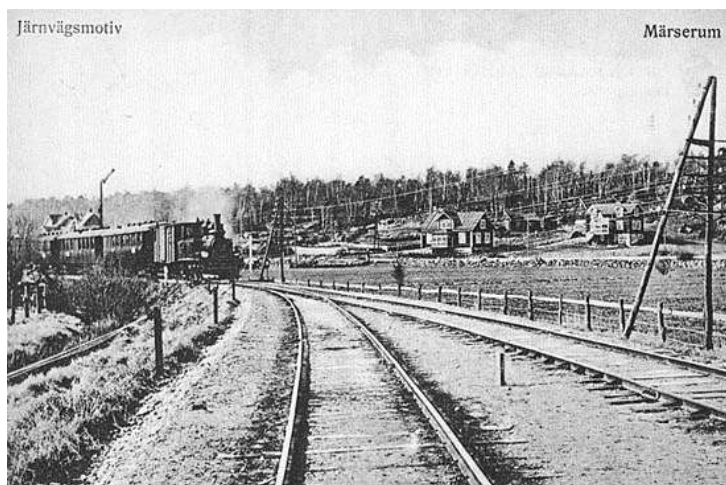
Västra infarten till Märserum