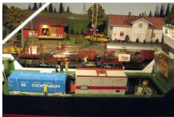
Tankvagnarna med ädelt innehåll