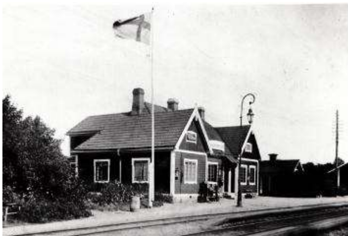
Detta foto är från 1910. Vi ser att unionsflaggan är ersatt med en helsvensk och att entrén till väntsalen är i mitskeppet

Märserum ligger 54 km från Karlskrona på dåvarande Mellersta Blekinges Järnvägar som öppnades för trafik i juni 1889. Rälslinjen på banan vägde då 17,2 kilo per meter och den största tillåtna hastigheten sattes till 30 kilometer i timman. 1906 bytte man namn till Blekinge Kustbanor, BKB. Stationen invigdes också i juni 1889 och nedlades 31 maj 1970. Stationen låg endast 10 meter över havet. Ursprungliga spårvidden var 1067 mm. BKB breddades sedan till normalspår 1957. För ett par år sedan elektrifierades banan också. Enligt uppgift revs stationen i februari 2010 men kan således fortfarande beskådas på vår anläggning i form av ALFSJÖ. Modellen är byggd av Fredrik Källquist som numera är boende på Jordö i Blekinge skärgård mellan Ronneby och Karlskrona.