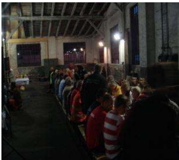
Middagen serverades i genuin tågmiljö

Övernattning hade ordnats för oss i BJ:s uppställda sovvagnar. Vi blev också bjudna på både frukost, lunch och middag. Lördagskvällen var det samling kl 20 och långbord hade dukats upp i lokstallet. Maten var verkligen superb och vi bjöds även god dryck till maten! Lite underhållning med frågesport ingick också.