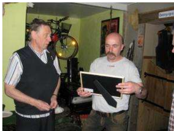
Ordförande överlämnar vår minnestavla