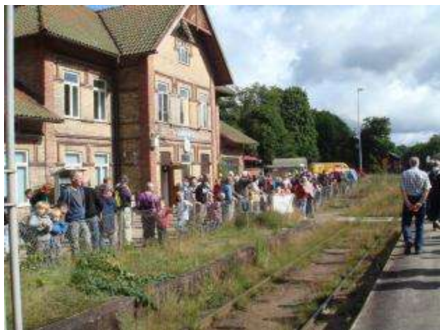
Det var mycket folk båda dagarna. Det fina vädret bidrog nog också. Det gamla stationshuset hade öppnats dagen till ära. Här kunde man köpa biljetter och betala genom de geniala "ut och in-skålar".