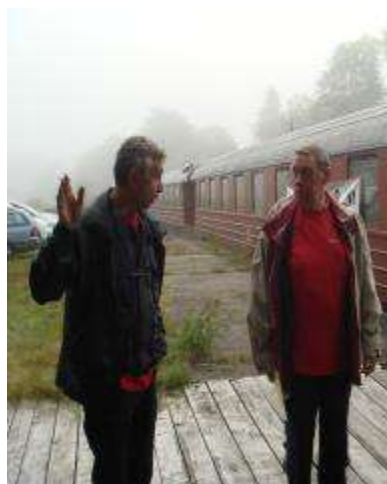
Undra vad Torbjörn försöker övertyga vår Ordförande om....