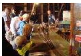
Tågtagarna i Landeryd