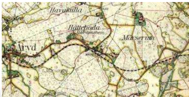
Karta från tiden innan man drog den nya motorvägen /motortrafikleden genom landskapet