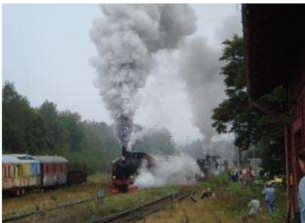
Två av ångloken drar igång för resa norrut. I sanning en pampig syn- och ljudupplevelse.