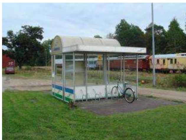
Det gamla hederliga stationshuset har numera ersatts av ovanstående glas/plåtskjul. Utvecklingen går framåt....