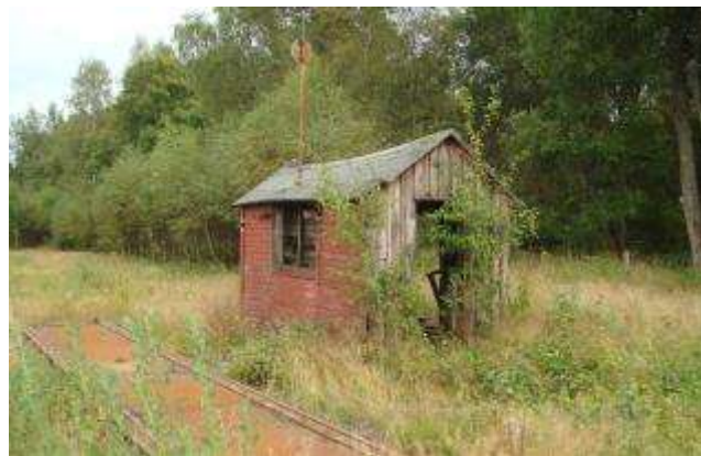
Ett Eldorado för den händig. Här rann inspirationen till och jag har byggt denna vagnvåg i modell.

Föreningen Landeryds Järnvägsmuseum har för avsikt att rusta upp hela stationsmiljön. För detta har man fått EU-pengar i ett projekt som skall vara i 3 år. Bangården ligger kvar intakt med upp till 6 spår. Tyvärr är alla utom 3 spår kraftigt igenväxta. Även spår 1,2 och 3 behöver en rejäl ogräsbekämpning. Kvar finns också godsmagasin och lokstall samt vagnvåg.