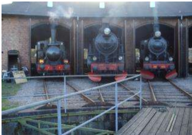
BLHJ, B och E2

De ånglok som skötte trafiken var 3 till antalet. E2 Nr 1333 från 1917 B Nr 1312 från 1916 BLHJ 2 från 1906 BLHJ utläses Bjärred-Lund-Harlösa Järnväg.