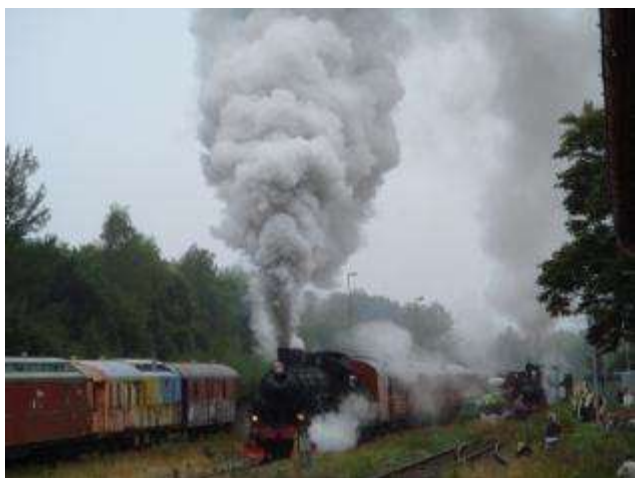
B-loket har just startat