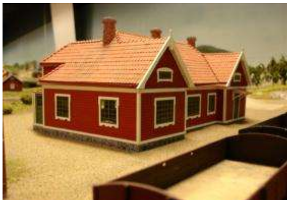
Vår modell som, efter att denna bild togs, har kompletterats med lite figurer och ett par trappor.