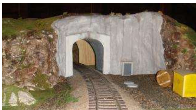
Betongportal och betongsprutat berg. Skönhetstävlingen vinnns dock av den sprängda tunneln